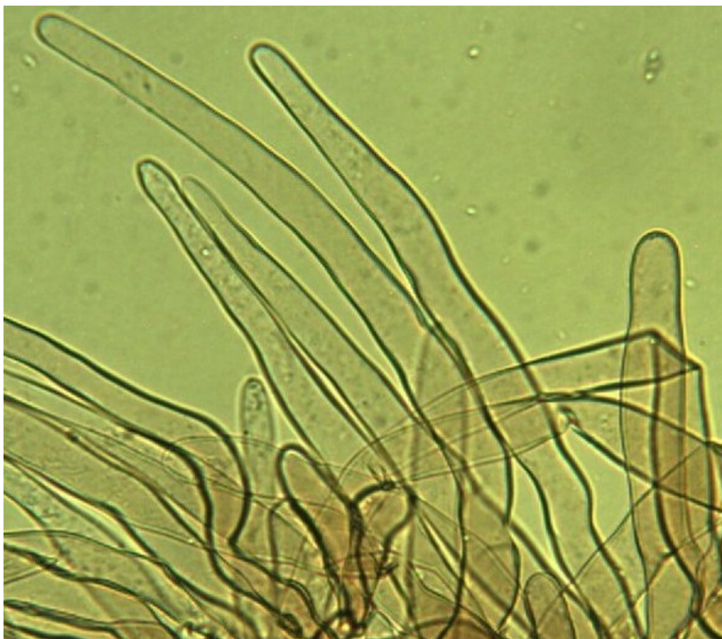
HDS: aus langen Haaren mit hymeniformer Unterschicht, Pigment vakuolär