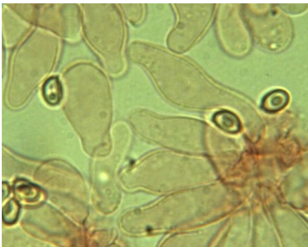
Cheilozystiden keulig, etwas utriform und schwach kopfig