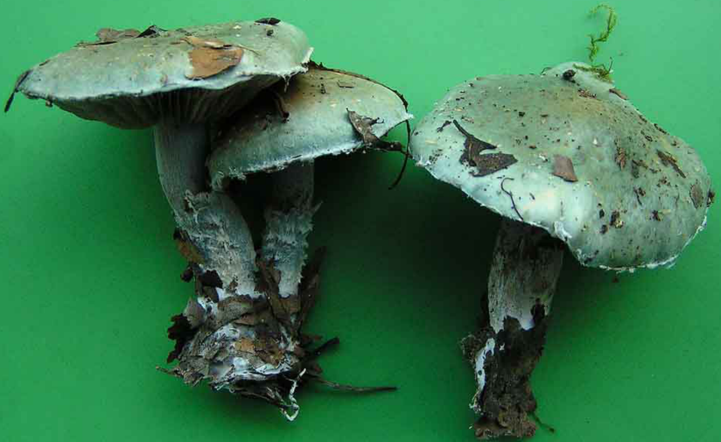
Stropharia caerulea Blauer Träuschling