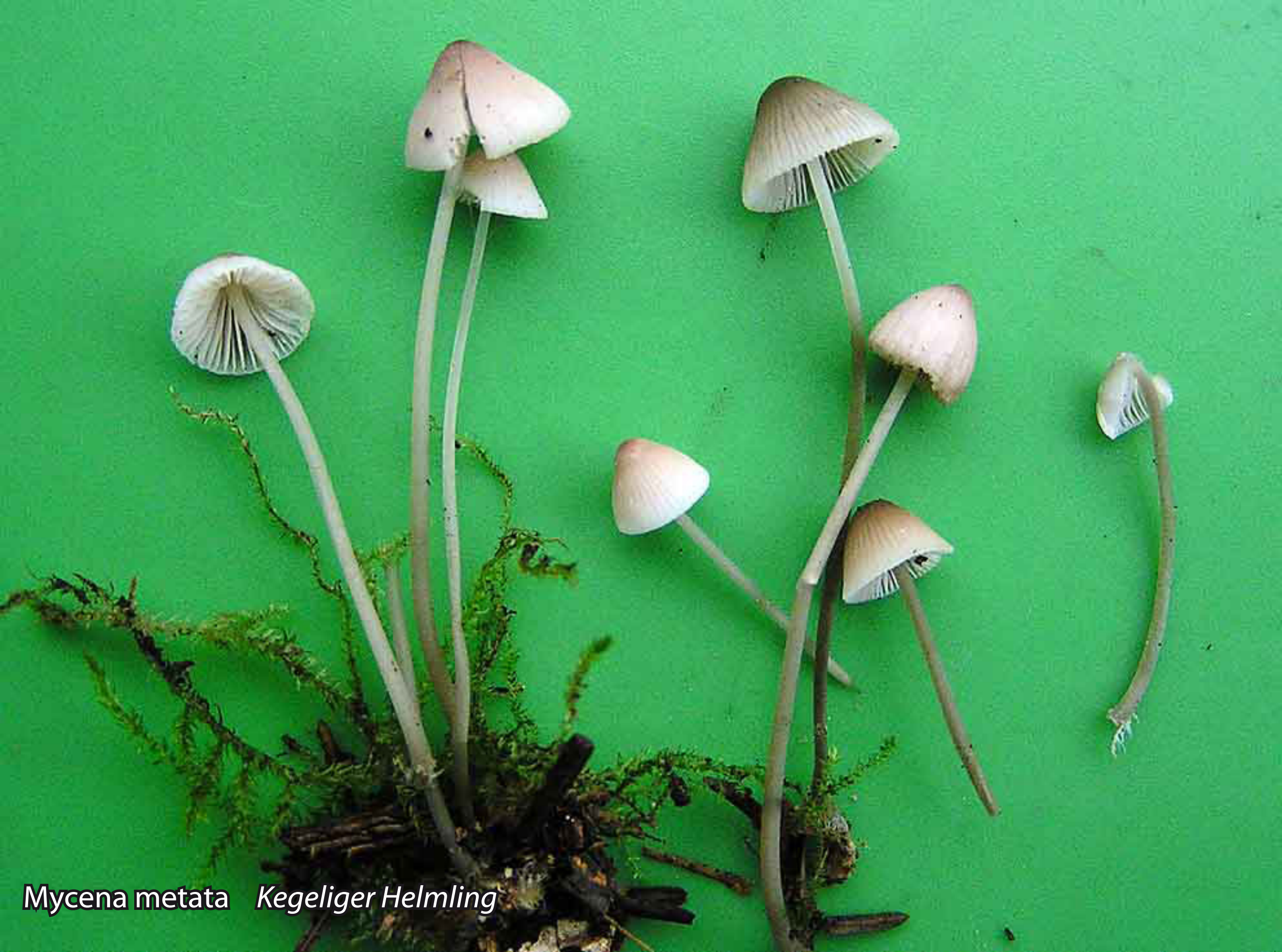
Mycena metata Kegeliger Helmling